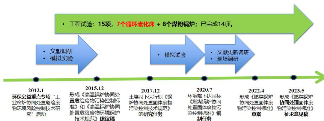
图 1 标准编制研究过程时间节点

台循环流化床锅炉，试验过程协同处理的固体废物类别包括 RDF、市政污泥等一般固体废物，也包括油泥、废活性炭、药渣等危险废物，其中 11 项工程试验开展了协同处理单一类别固体废物的研究，4 项工程试验开展了协同处理多类别固体废物的研究。